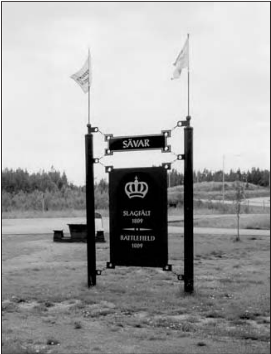
Minnesmärket i Sävar över slaget 1808-09 mellan ryssar och svenskar.