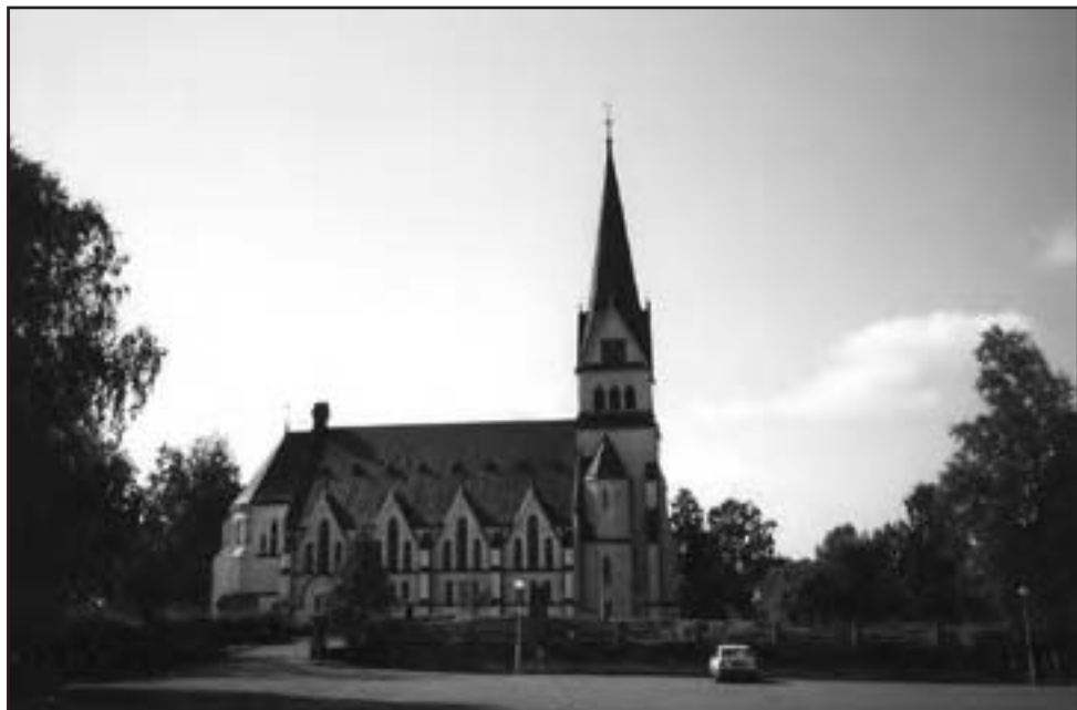
Skönhet i norr lockar. Vindelns kyrka utsågs till Sveriges vackraste 2004 av veckotidningen Året Runt. .Foto: Göran Jordung.

Så kommer vi då till LYCKSELE, som blev välkänt under 1950-talet vid de arkeologiska utgrävningarna vid bl a Juktån. Lycksele blev stad på 1940-talet. Vi besöker Gammlplatsen, där en marknadsplats anlades innan märkta gränser mot Norge kom till. Det var efter beslut c:a 1606 av Karl IX och hans lappmarkspolitik, som detta skedde. Marknadsplatsen var dock långt före detta i bruk. 1947 blev