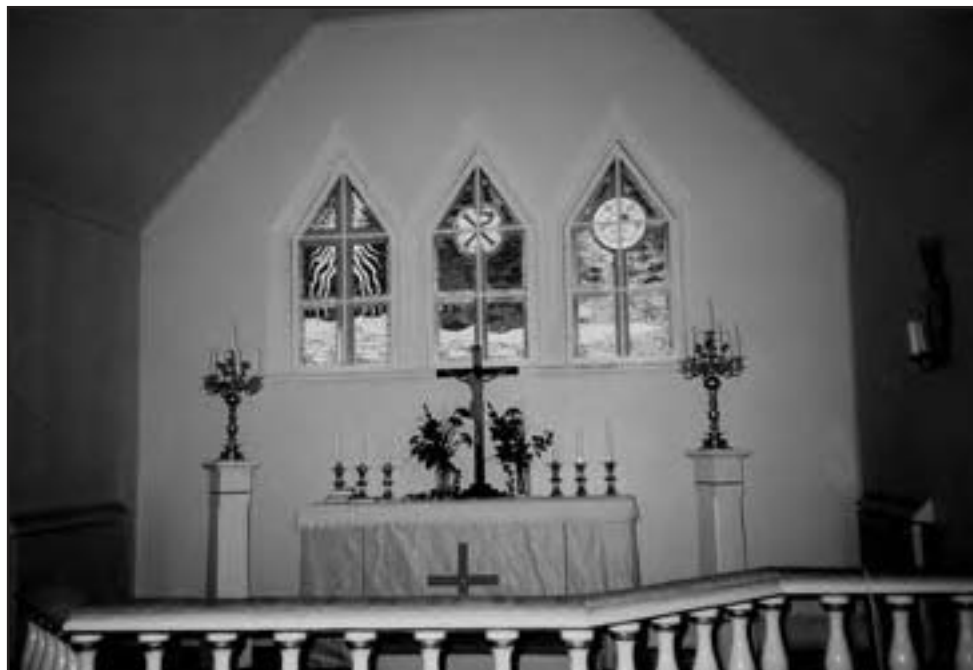
Interiörbild av altaret i Pållems kyrka.

en storslagen lunch med massor av olika sorters mat. Lassbygården var en B3-skola, berättar Kurt Erik Strand. Den ägs och förvaltas nu av Lassbyns hembygdsförening. I den övre våningen är inrett några rum, som man kan hyra för övernattnig.