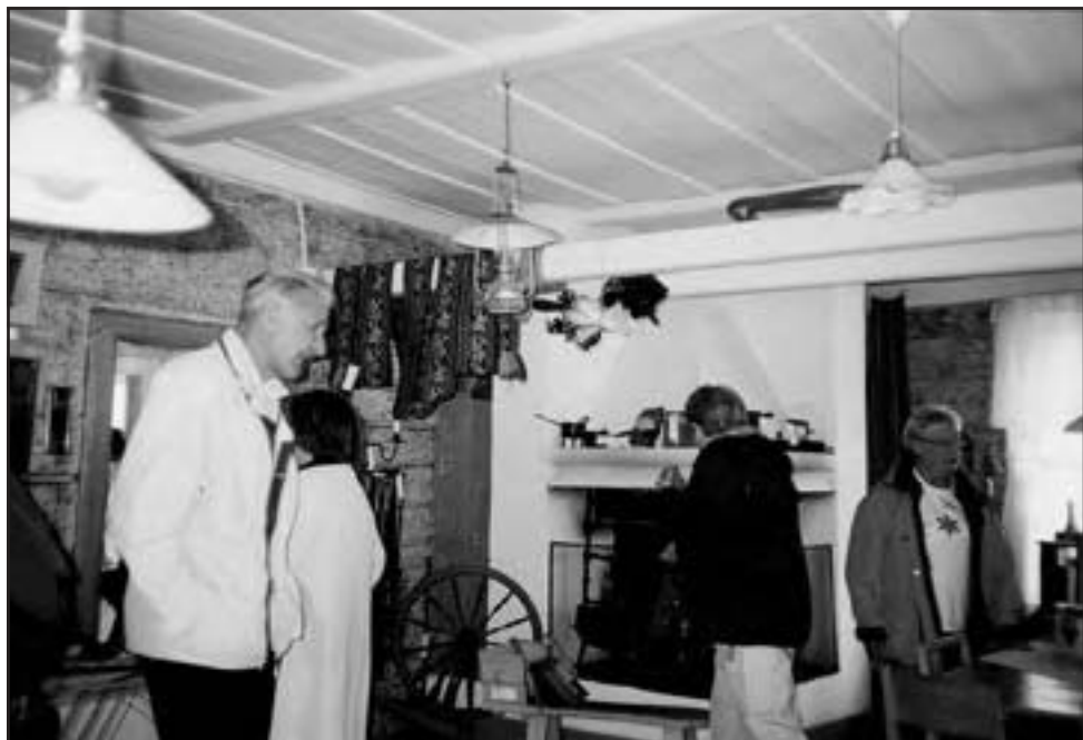
Råneå hembygdsförening har en stor föremålssamling i huvudbyggnaden.