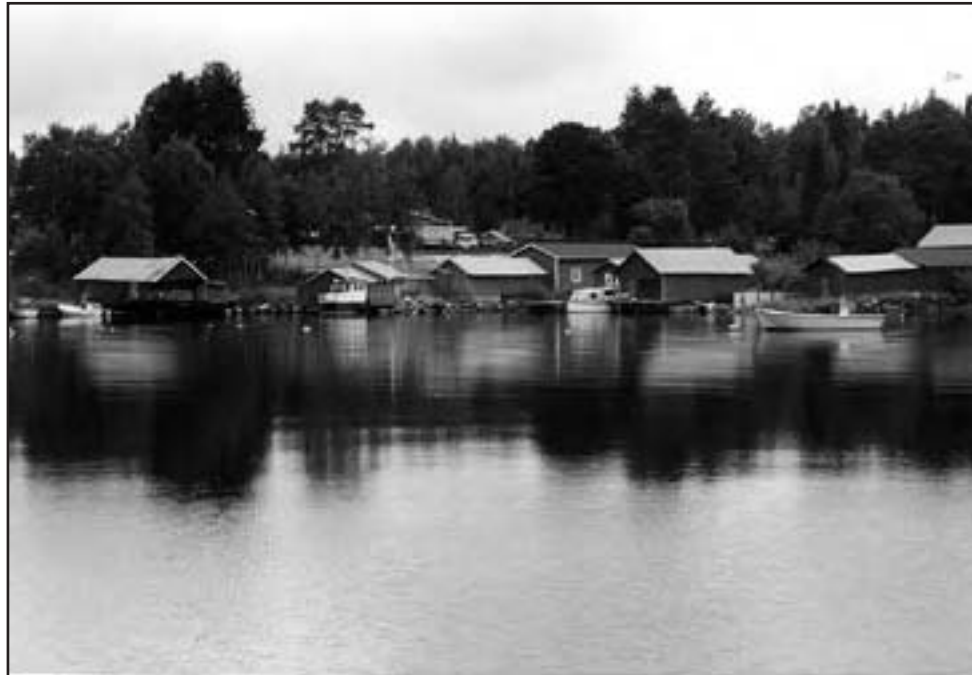
Storöhamn fiskeby där det mesta av den fisk som fångas vid kusten tas om hand. Det är bl.a. härifrån som en del av den välkända löjrommen och surströmmingen kommer. Här den gamla hamnen.

Vi fortsätter resan mot Storöhamn, en kustby som främst levt på fisket och i viss mån jordbruk. Det goda fisket i havet och de skyddade hamnlägena gjorde att byn befolkades tidigt av ett fiskande och boskapsskötande folk. Det var främst lax, strömming och siklöja som fiskades. När den första bebyggelsen tillkom vet man ej med säkerhet. I skriftliga källor nämns byn första gången år 1539 som en del