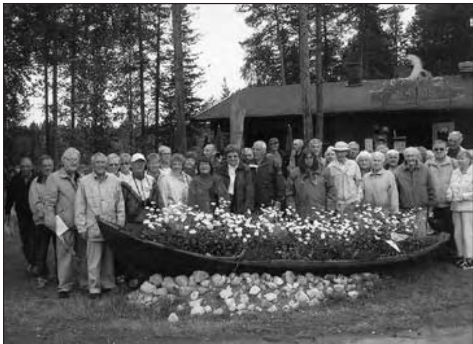
Resenärerna samlade invid den blomsterfyllda forsbåten i Jokkfall.