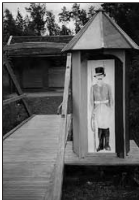
Vaktpost utanför informationstavlorna om slaget vid Sävar 1808-09.