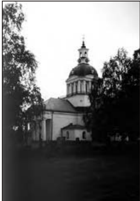
Skellefteå kyrka.

Kjell berättar, att här i Västerbotten finns också rundlogar men här med en särskild påbyggnad ett litet "hus", där det tröskade kornet förvarades. Det var till skydd för råttorna man gjorde denna påbyggnad. Dessa rundlogar kallas för "burträskmodellen".