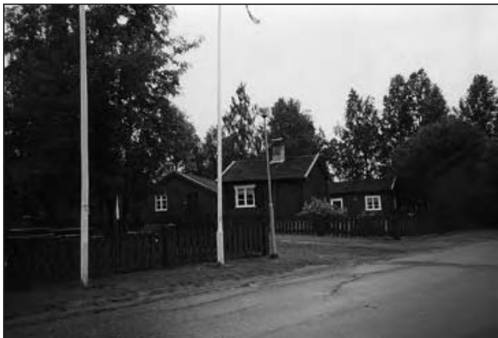
I anslutning till Gammlia ligger även Västerbottens museum.