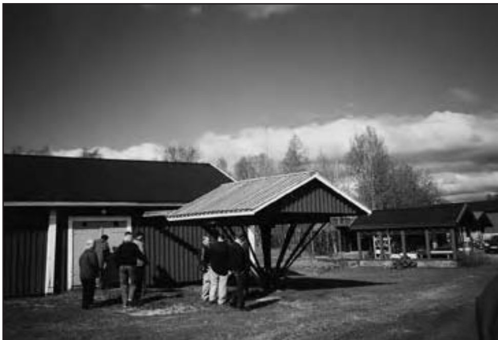
Hembygdsgården "Lundströms gård" är från 1700-talet. När hembygdsföreningen bildades 1954 köpte man denna fastighet som idag består av bagarstugan Klapphällskroger, stall med tröskloge, bodar och gårdssmedja från Böle. Mitt i bilden tröskvandringen.

Färden fortsatte till Råneå kyrka. Intill kyrkan finns tyvärr inte många kyrkstugor kvar. Nuvarande kyrka är byggd på 1850-talet. Folkmängden hade