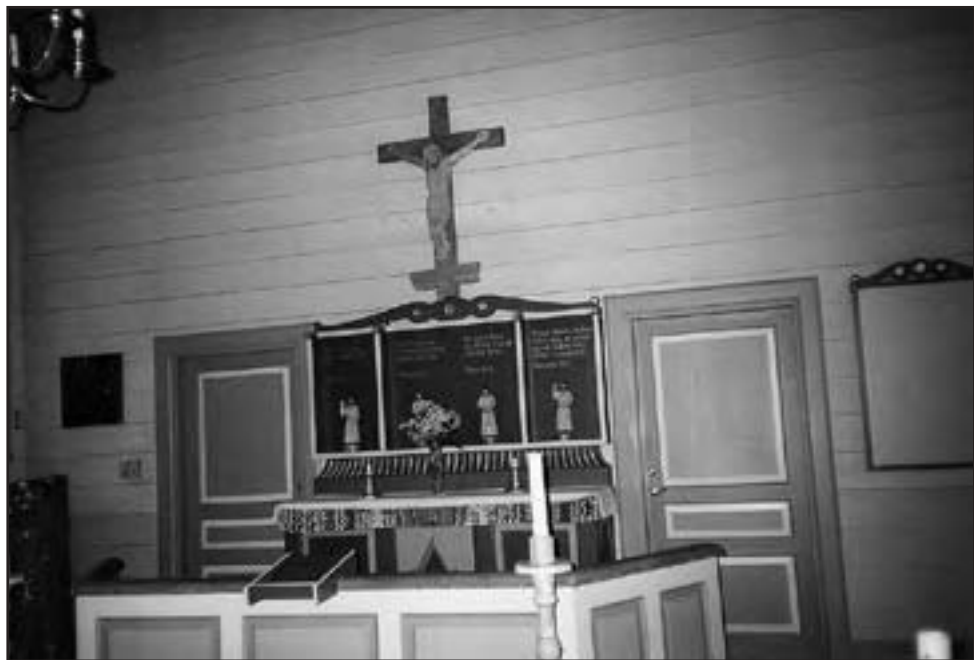
Margaretakyrkan används sommartid och har stor betydelse för platsen. Den byggdes 1973 och är en rekonstruktion av en äldre kyrka, uppförd 1736.

Gammlplatsen friluftsmuséum dit man flyttade gamla byggnader samt uppförde ett skogsmuséum.