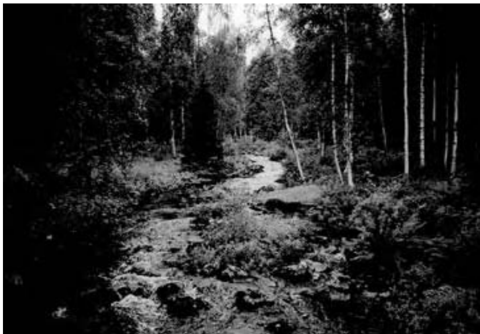
Pålänge å rinner vacker genom skogen. Förr har det funnits ett kvarn område med skvaltkvarnar.

av byn Ryssbält och 1547 som egen by. På äldre kartor ses ett sund i områdets norra del benämnt Kompanasund. Sannolikt är att det var vid detta sund, som mötet mellan biskoparna i Åbo och Uppsala år 1347 skedde. Mötet tillkom för att bestämma var stiftsgränsen skulle gå.