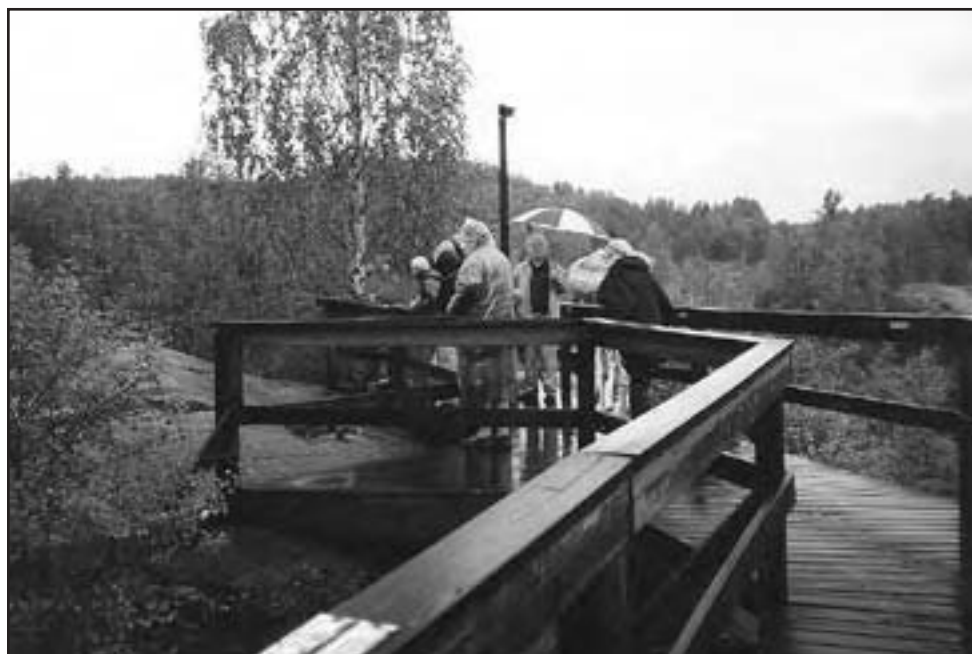
Vid hållristningarna i Stornorrfors har man spångade leder fram till objekten.