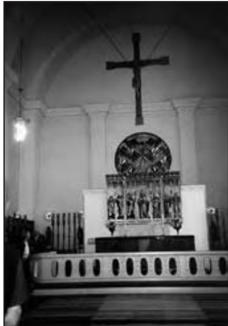
Skellefteå kyrka och det vackra altaret.