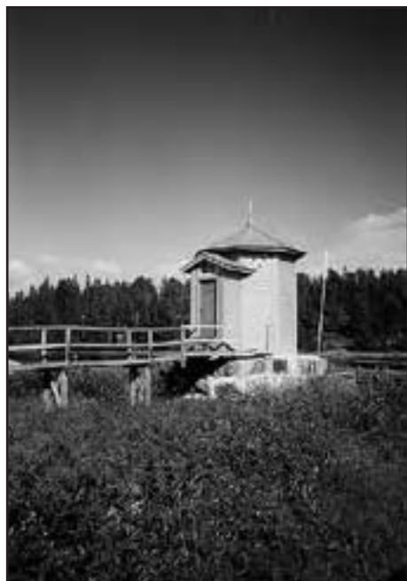
Mareografen uppfördes 1891 för att mäta vattenståndet i Ratans hamn.