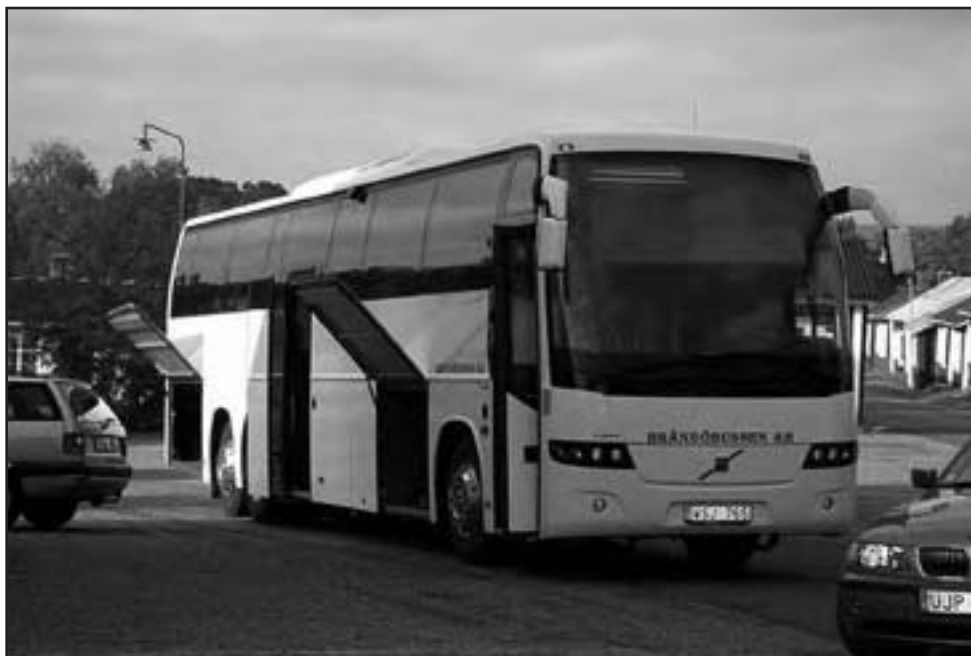
Bussen lastad och klar inför avgången från den sedvanliga platsen - klockstapeln.

Han berättar, att Öjebyn är “syster” till Gammelstad; Piteå gamla stad 1621 flyttades 1666 till Häggholmen; kyrkstaden mycket likt Gammelstads men med traditioner av andra kyrkhelger än de i Gammelstad – Påskhelgen är “stor” i Öjebyn.