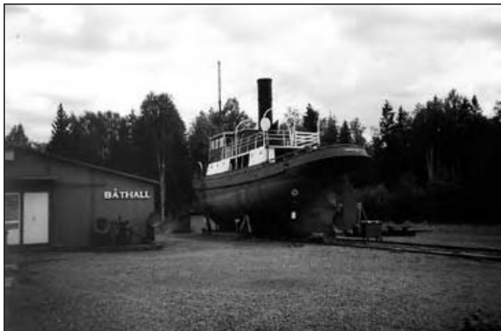
På Stackgrönnans båtmuseum finns Sveriges största samling av båtmotorer.