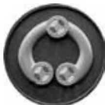
Kringlan - Skellefteå museums logotyp.