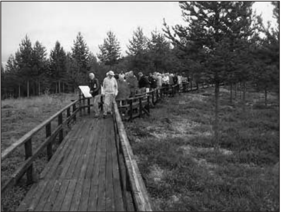
Den hittills mest unika stenåldersboplatsen Lillberget i Överkalix.. Boplatsen är 6000 år gammal och det som gör den unik är fynden av kamkeramik och rödockra.